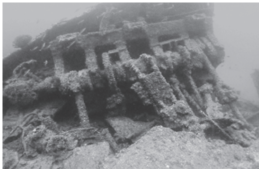
写真 1 蒸気往復機関のCONNECTING・ロッド3本がクランクに接続されている

尚、同名のより大きな船（4,046 総トン、この船も小笠原海域嫁島の東で沈んだ）が同じく海軍の徴用船になっていた関係で、海軍では本船は「第二号日吉丸」と呼ばれていた。