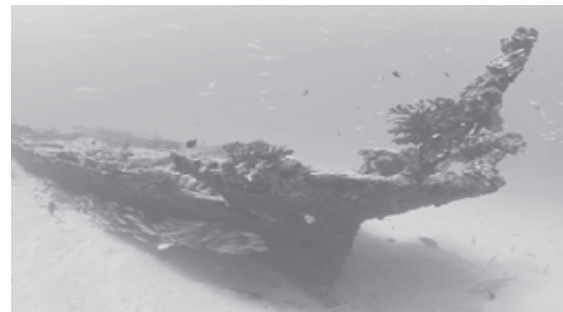
写真2 第二西海丸(推測) 高さ3.5mの船尾部分(長さ27.3m)、この先に破断した船首部分がある。